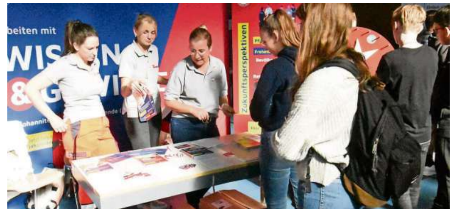
Bei der zweitägigen Jobbörse gibt es neben Infoständen auch zahlreiche Vortragsveranstaltungen.

An einem zentralen Ort wird die Möglichkeit geboten, ungezwungen Informationen zu einzelnen Ausbildungsberufen und Studiengängen zu erhalten. Es stehen wieder zahlreiche Fachleute aus unterschiedlichen Branchen und Bereichen mit Rat und Tat in einem persönlichen Gespräch zur Verfügung. Sei es Studium, kaufmännische Ausbildung, technische Ausbildung, medizinische Ausbildung und vieles mehr. Fragen wie: Wie lange dauert die Ausbildung?, Welche Noten oder welchen Schulabschluss benötige ich?, Gibt es einen Numerus Clausus?, Wie sieht mein zukünftiges Arbeits- und Tätigkeitsfeld aus?, Welche Aufstiegsmöglichkeiten habe ich in meinem Wunschberuf?, um nur einige Fragen zu nennen. Über die Be Future! wurden in den vergangenen Jahren ebenfalls Praktika abgesprochen und so manche Ausbildung oder